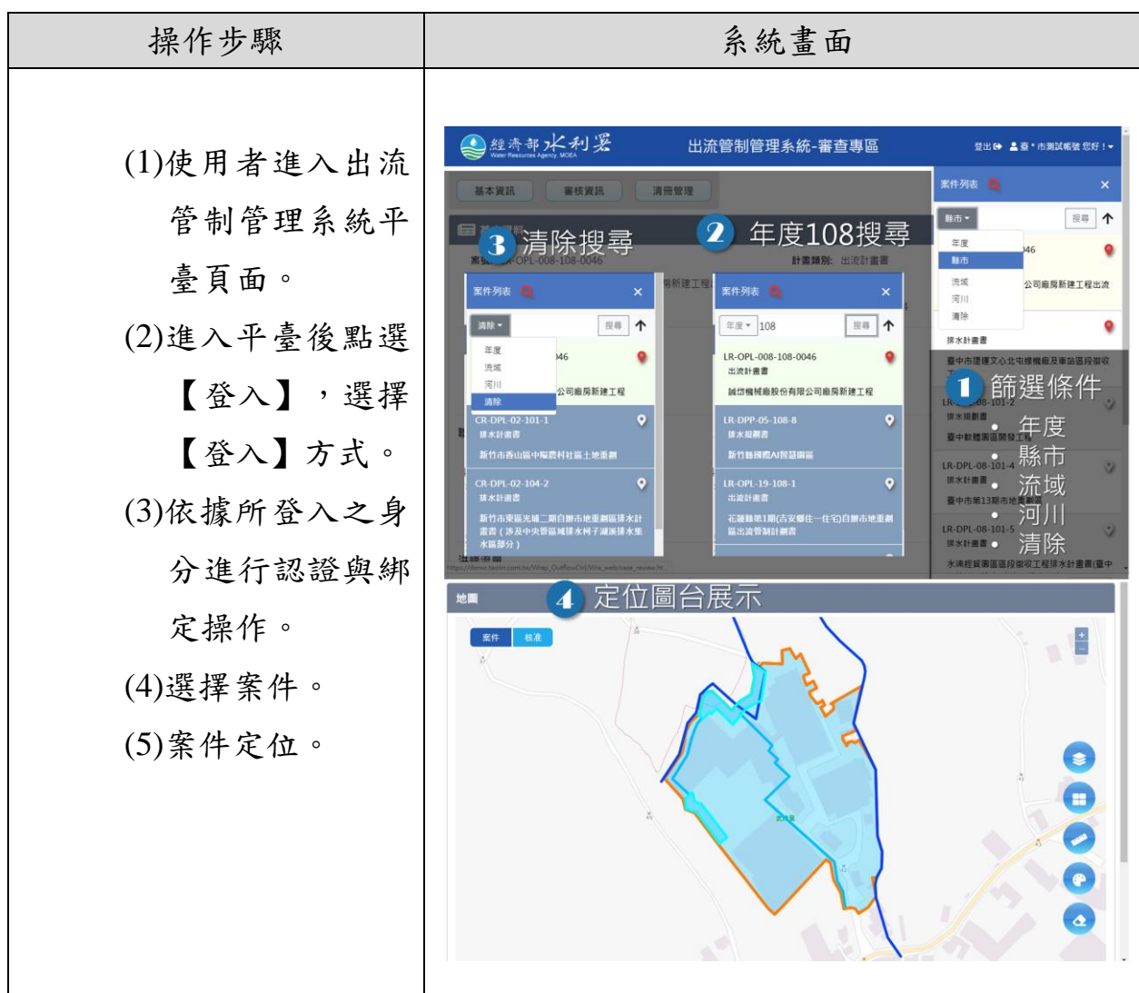
圖 2-2 案件選擇及篩選作業服務畫面及操作流程

依據登入單位轄區內所建立之案件紀錄，設計使用者案件選單供選取歷次案件之紀錄，列表資訊主要提供案件編號、計畫階段、計畫名稱、定位圖台展示等功能。