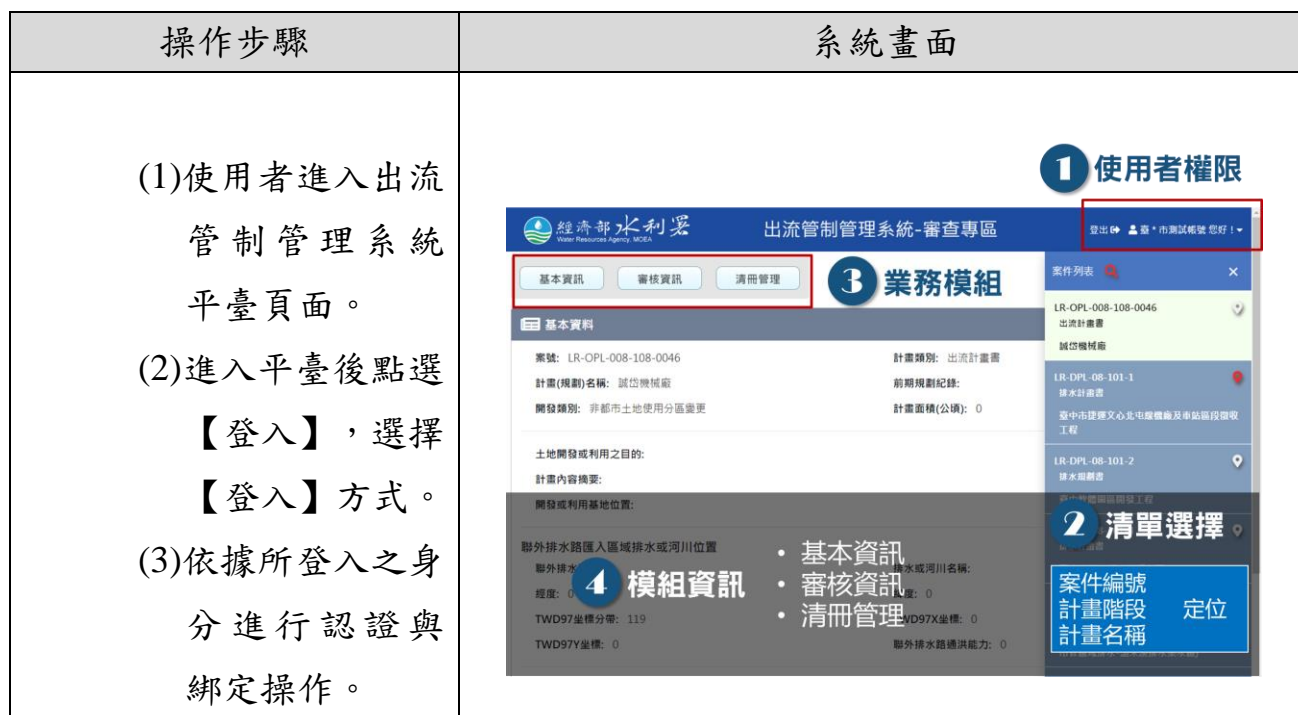
圖 2-1 身分認證服務畫面及操作流程

審查專區系統網頁身分認證方式，於登入畫面選擇認證方式後，分別輸入審查單位所申請之帳號密碼後，依據所登入之身分進行認證與綁定操作。審查單位登入後，系統自動將帳號與計畫所管轄單位(中央審查則為河川局及計畫所在地縣市政府、地方審查則為縣市政府)進行資料綁定，若需要進行單位資料修改則需由後台管理進行修正紀錄。