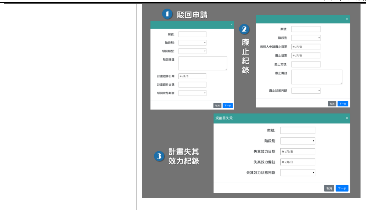
圖 2-4 審查資訊服務畫面及操作流程