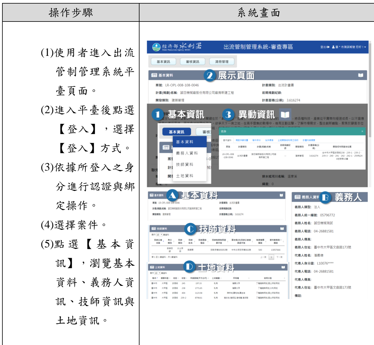
圖 2-3 基本資訊服務畫面及操作流程

基本資訊主要將義務人及委託執行技師所填寫案件之基本資料與各計畫階段所需登打輸入之內容進行檢視查詢與異動紀錄查詢，基本資訊內容主要包含基本資料、義務人資訊、技師資訊與土地資訊等內容。